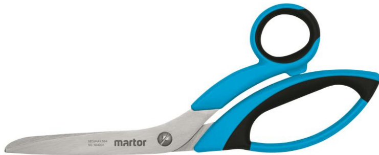
SECUMAX 564 NR. 564001.00