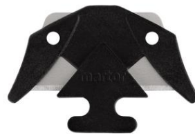
SECUMAX Klinge NR. 3550.20