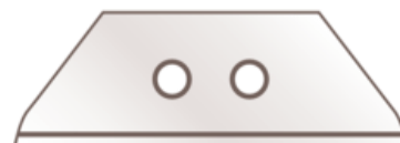
Trapezklinge 60099 NR. 60099.70