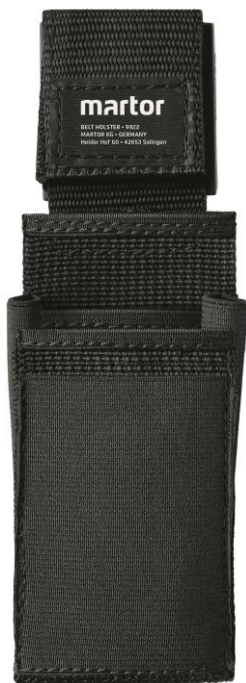
Gürteltasche L mit Clip NR. 9922.08